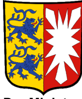
Der Minister für Bildung und Kultur des Landes Schleswig-Holstein